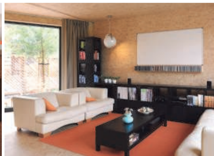
Alle wanden en vloeren in huis zijn uitgevoerd in OSB-platen. De verlichting is van Leitmotiv.

broken moet worden.» Het meest opmerkelijke is echter de energiefactuur. «We betalen zo'n 10 euro per maand aan gas en elektriciteit. De energie die we nodig hebben, winnen we terug met 18 zonnepanelen op het dak. En de zon is onze verwarming. Die kan volop binnen schijnen via de twee zuidgerichte ramen in de uitsnede van de kubus. Door de dikke isolatie wordt de warmte heel lang vastgehouden. In de zomer blijven de zonnestralen buiten dankzij lamellen en het bladerdek van twee boompjes.» De lamellen zorgen ook voor privacy in de slaapkamer van de ouders, waar nog twee bureaus zijn ingericht. Bijna alles is hier open. Twee kastenwanden in groene, afwasbare mdf, aan elke zijde van de trap, vormen de enige afscheiding. «Alles is wel aanwezig om het kindergedeelte later met een paar eenvoudige ingrepen op te delen in meerdere kamers.» Over elk detail is nagedacht.