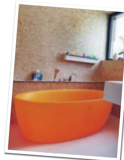
Blikvanger in de badkamer is het oranje bad van Aquamass.