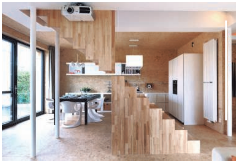
Aan de tweedelige houten trap - een eigen ontwerp - hangt de projector om tv te kijken.